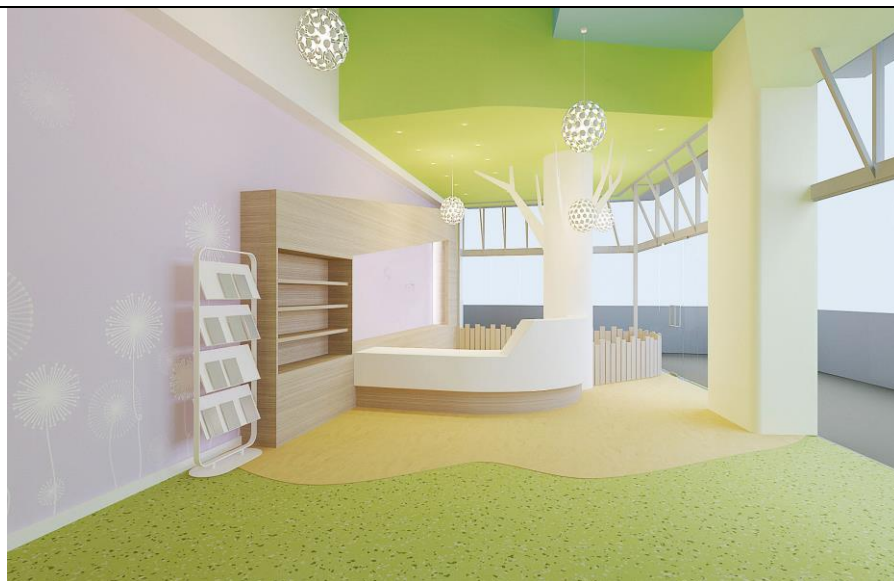
北歐森林風格 參考